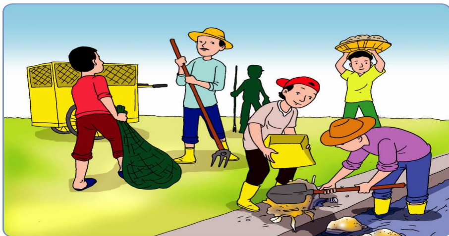
Gambar 7.2 Membersihkan lingkungan

Menjaga, merawat, dan memelihara alam dengan baik berarti tidak merusaknya. Lakukan dengan bijaksana untuk kepentingan kita dan kehidupan generasi Merusak alam sama artinya dengan merusak masa depan generasi yang akan datang. Menjaga alam artinya menjaga generasi yang akan datang. Kalian bisa menjaga dan melestarikan lingkungan alam dengan mengambil perilaku lebah. Lebah memberi inspirasi tentang penggunaan alam yang sangat terbatas. Lebah bukan hanya mencari keuntungan mengambil madu, tetapi lebah memberi penyerbukan pada bunga. Demikian kita hendaknya menggunakan sumber daya alam dengan bijaksana sesuai ajaran Buddha.