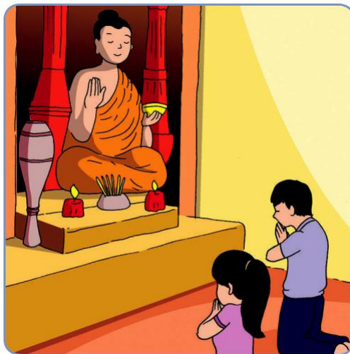
Gambar 2.1 Berdoa di depan altar