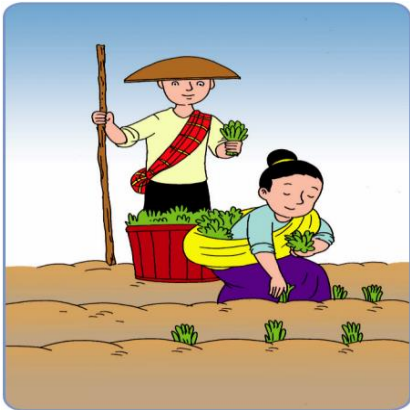
Gambar7.3: Orang sedang bercocok tanam

Bumi dan alam sekitar yang kita tinggali saat ini harus dijaga agar menjadi tempat yang nyaman bagi semua. Di tempat tersebut, selain manusia juga ada binatang dan tumbuhan. Mereka hidup berdampingan saling menguntungkan. Tentunya supaya kita dapat hidup dengan nyaman, kita wajib menjaga alam ini dengan bijaksana. Jangan merusaknya. Kita seyogianya bersahabat dengan mereka. Alam telah memberikan kita banyak hal untuk kehidupan kita.