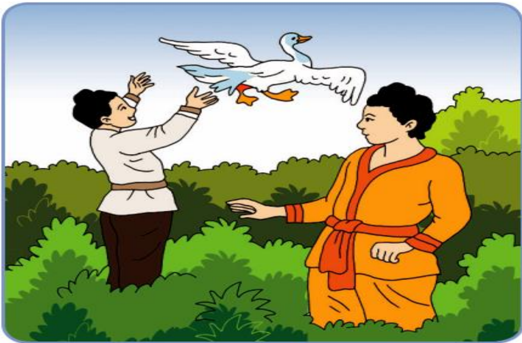
Gambar 2.3. Pangeran Siddharta menolong angsa