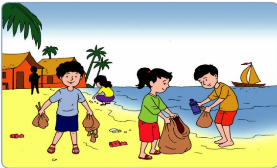
Gambar 7.1 Membersihkan lingkungan

Kita semua tinggal di sebuah lingkungan. Lingkungan yang kita tinggali berbeda satu sama lain. Ada yang tinggal di dekat pantai dan pegunungan. Ada pula yang tinggal di desa maupun di kota, dan sebagainya. Hal yang terpenting, di mana pun kita berdiam, di situ kita menjunjung nilai-nilai kebersamaan dan gotong royong. Tanpa melihat perbedaan di antara kita. Seperti kita ketahui bahwa bangsa kita sangat beraneka ragam suku, ras, agama, antargolongan, budaya, dan lain-lain. Namun walaupun kita berbeda-beda, kita tetap satu bangsa Indonesia yang selalu saling membantu dan bergotong royong satu sama lainnya.