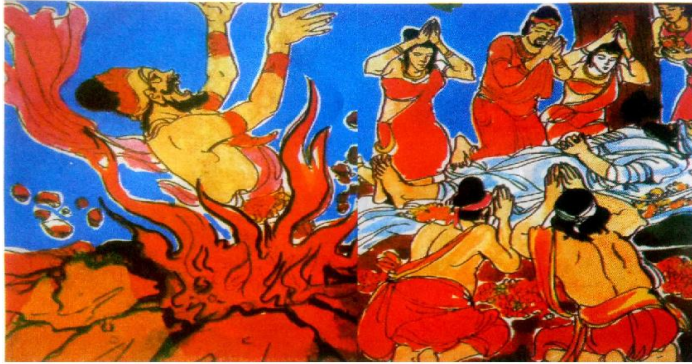
Gambar: 6.2 Kesabaran Bodhisattva