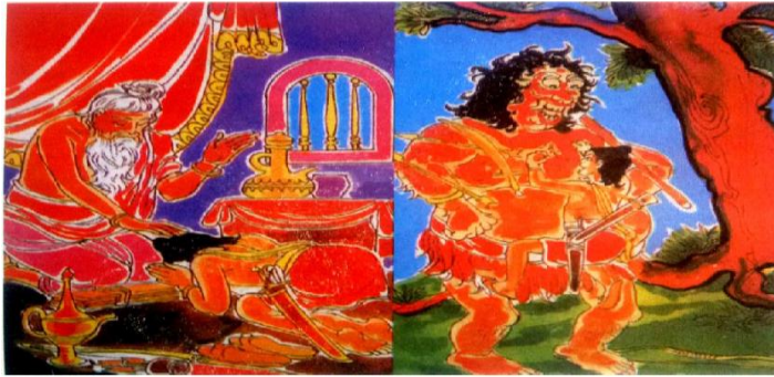
Gambar: 6.1 Usaha Semangat Bodhisattva

Bodhisattva selalu semangat untuk melakukan kebajikan. Ayo, amati gambar di bawah ini dan ceritakan semangat seorang Bodhisattva.